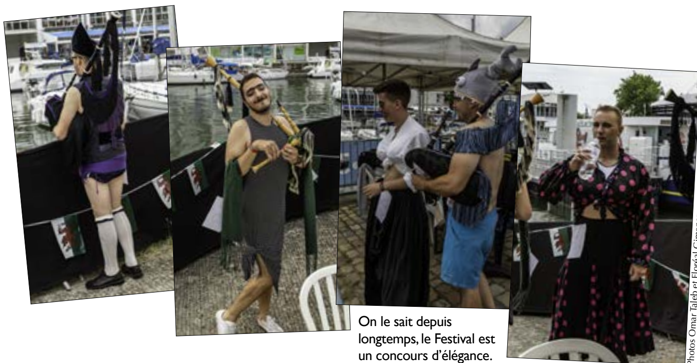
On le sait depuis longtemps, le Festival est un concours d'élégance.