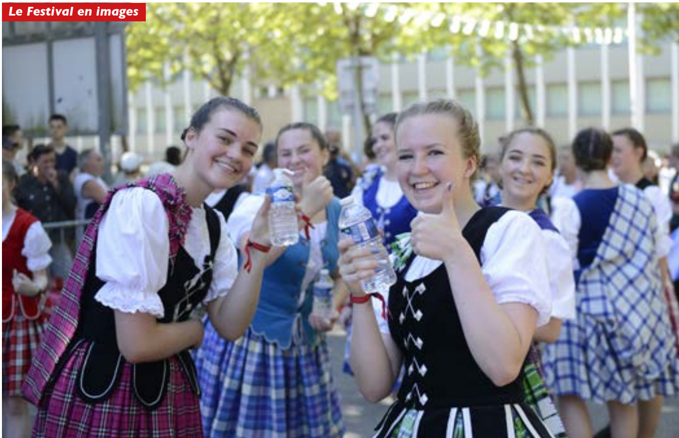
Ne sont-elles pas heureuses... et craquantes, les danseuses écossaises qui découvrent le FIL ?